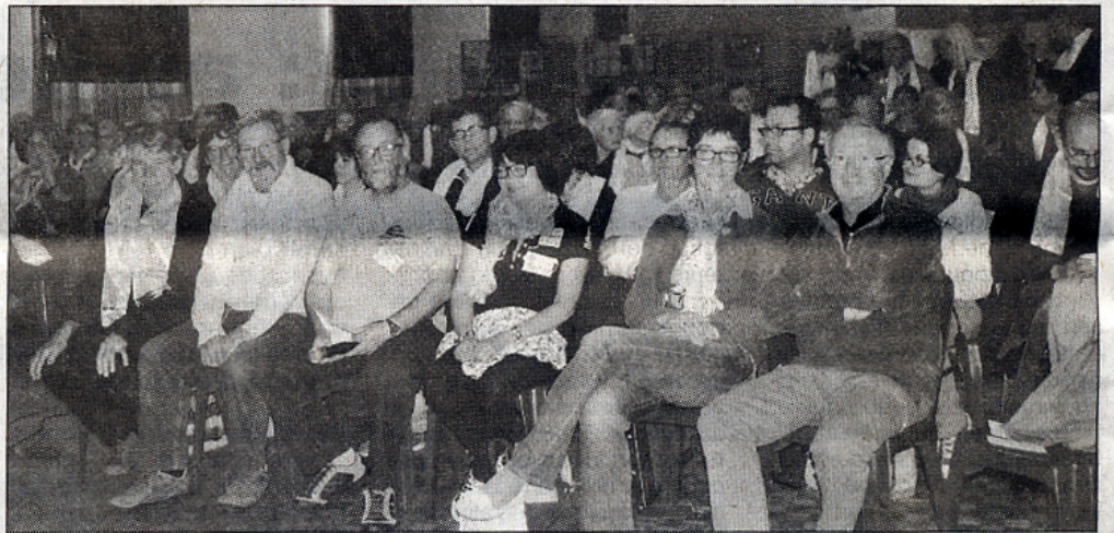
Durant ces deux jours, la salle communale était comble.