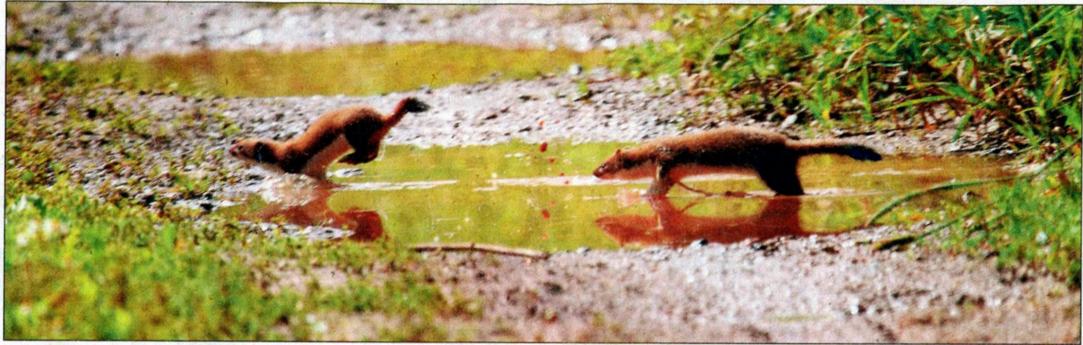
Deux hermines au détour d'un petit sentier dans le marais de Gaignes.

Ses sites privilégiés : le marais, les ponts d'Ouve, le marais de Gaignes où il est propriétaire d'un gabion, le château de la Rivière et les réserves naturelles de Beauguillot et Saint Georges de Bohon. « Le port de Barfleury m'a également beaucoup inspiré avec ses lumières et ses bateaux échoués » a-t-il précisé.