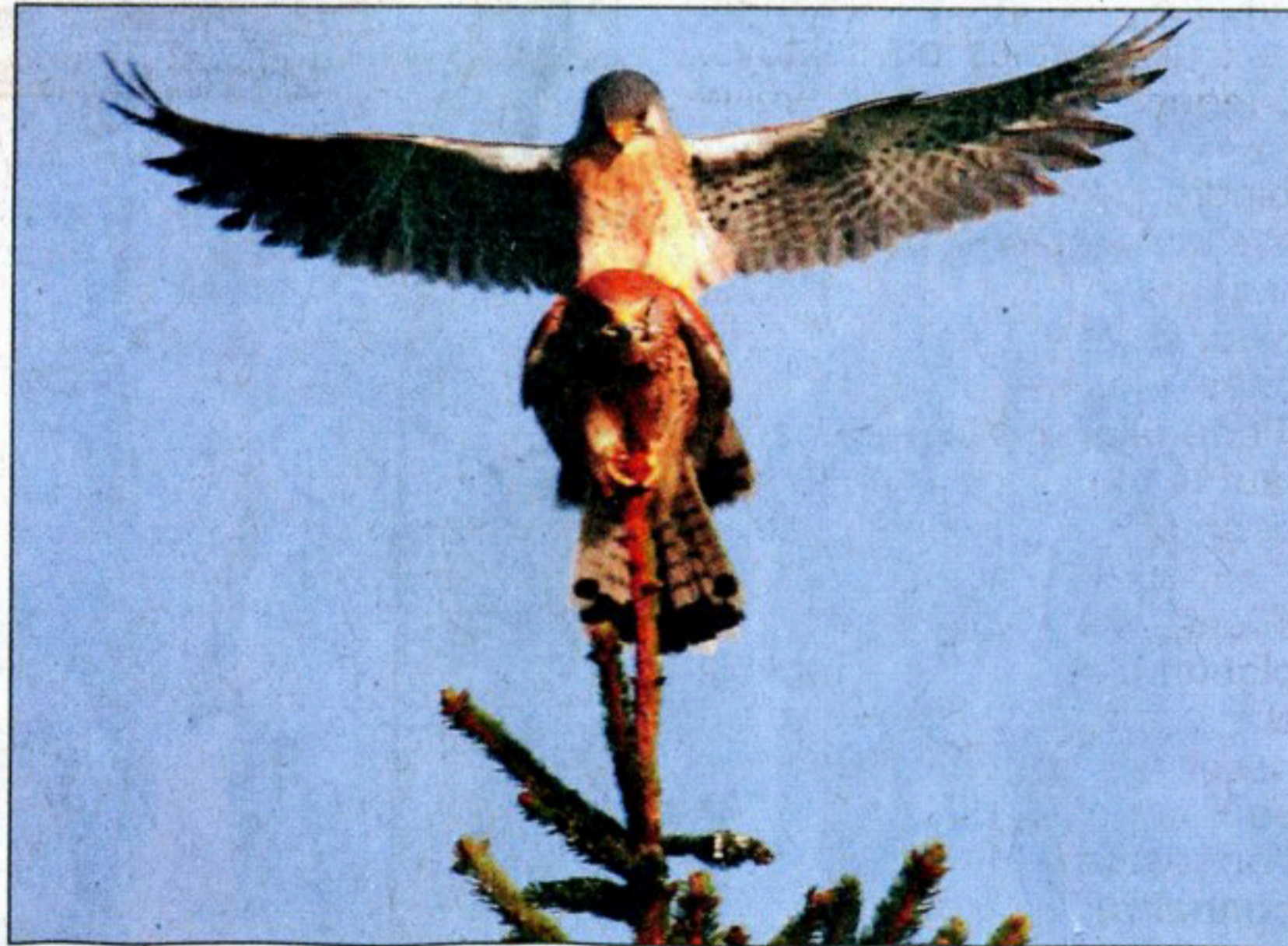
Un accouplement de faucons crécerelles au château de la rivière à Saint Fromond.